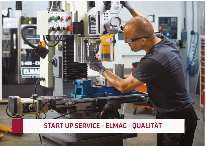
START UP SERVICE - ELMAG - QUALITÄT